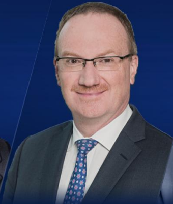
Prof. Lars P. Feld

Honorary Dean, National School of Development, Peking University