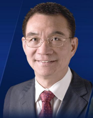
Dr. Justin Lin

Honorary Dean, National School of Development, Peking University