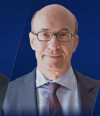
Prof. Kenneth Rogoff

Chairman, German Council of Economic Experts